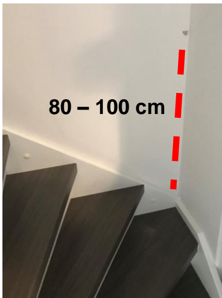
Markeer 80-100 cm boven de trede