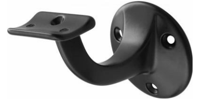
A. Smetplanken of houten/gips muur