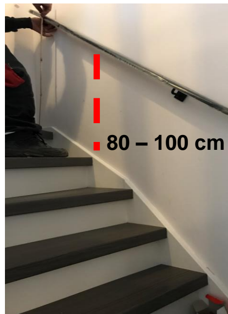
Zorg dat de leuning 80 – 100 cm boven de traptreden hangt