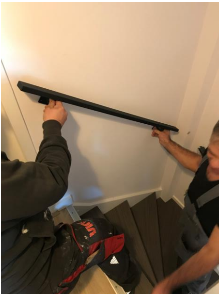
Positioneer de korte leuning