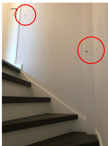
Zet een markering aan het begin en einde van elke wand