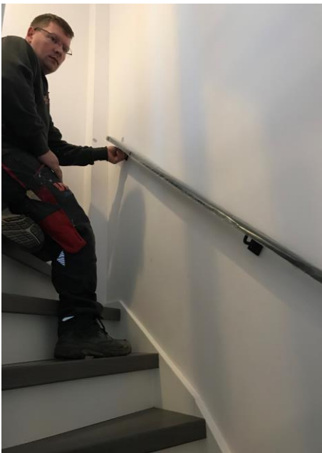
Positioneer de leuning op de aangebrachte markering