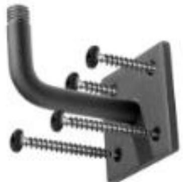
C. Stalen leuning(en)